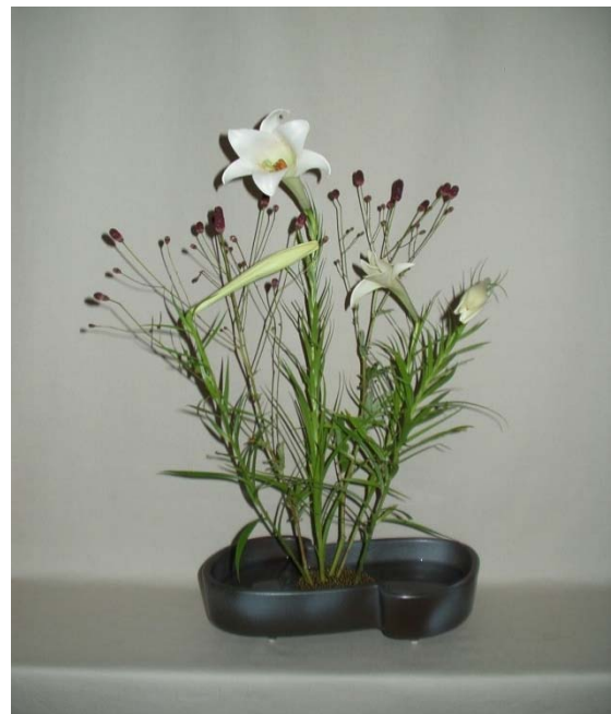
(4) 体の向う添えに新鉄砲ユリ後添えワレモコウを活けましょう。