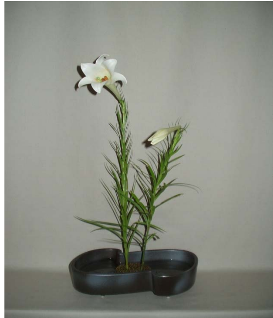
(2) 用は体の斜め前方に少し空間を開けて活けましょう。