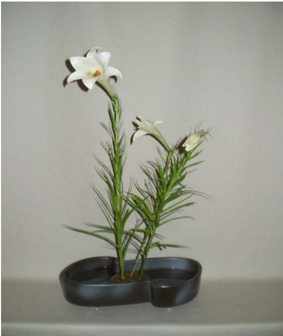
(3) 後添えは奥行きを持たせるためにバランスを考えて活けましょう。