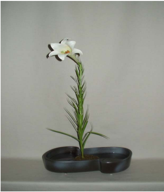
(1) 左やや前方に体を活けましょう。